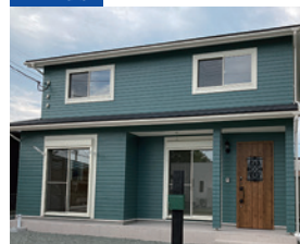
スマイルコンセプトハウス お支払い例